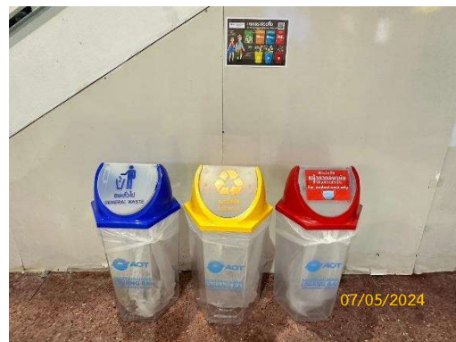
รูปที่ 3-9 ถังขยะแยกประเภทบริเวณอาคารผู้โดยสาร