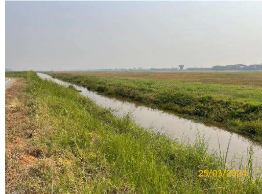
รางระบายน้ำในเขต Airside