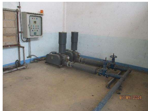
รูปที่ 3-1 ปั๊มเติมอากาศสำหรับระบบบำบัดน้ำเสีย