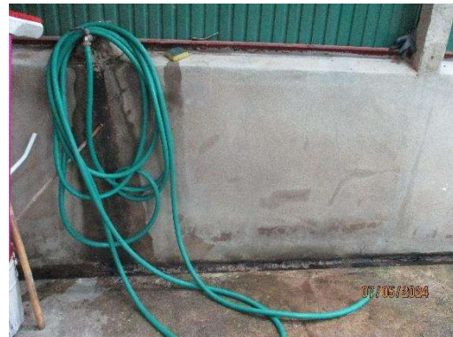
รูปที่ 3-12 สายยางสำหรับทำความสะอาด อาคารพักขยะ