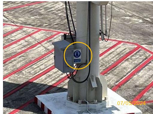
รูปที่ 3-18 ป้ายเตือนให้สวมใส่เครื่อง ป้องกันเสียง