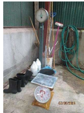
รูปที่ 3-14 ตาชั่งน้ำหนักขยะ