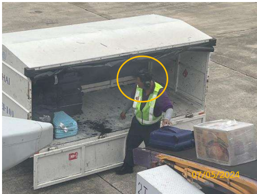
รูปที่ 3-17 พนักงานสวมใส่เครื่องป้องกันอันตราย ส่วนบุคคล ประเภทป้องกันเสียงดัง (Ear Muffs)