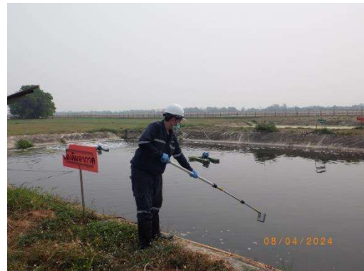
รูปที่ 3-7 การติดตามตรวจสอบคุณภาพน้ำทิ้ง ในระบบบำบัดน้ำเสีย (บ่อที่ 1 บ่อเติมอากาศ)