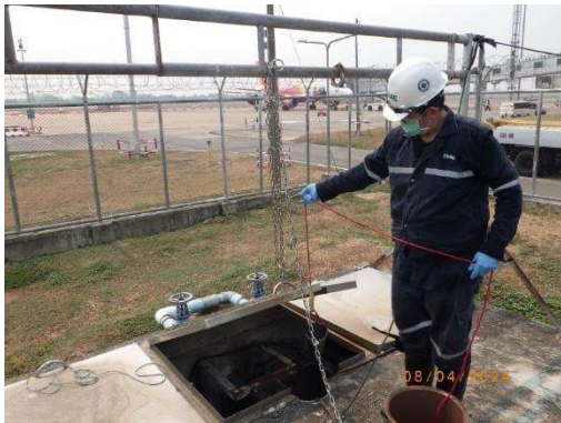
รูปที่ 3-6 การติดตามตรวจสอบคุณภาพน้ำเสีย ก่อนเข้าระบบบำบัดน้ำเสีย (บริเวณบ่อกักน้ำเสียช่องทางที่ 1)