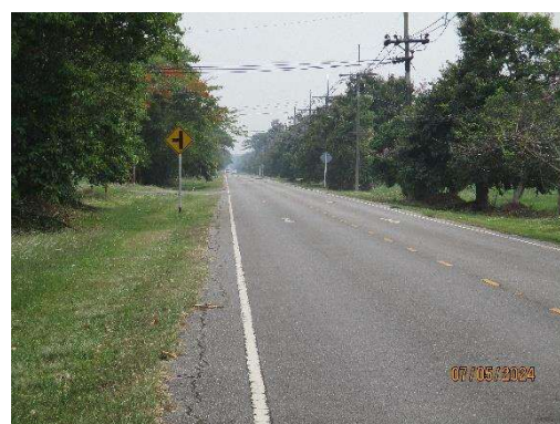
รูปที่ 3-22 บริเวณไหล่ถนนรอบท่าอากาศยานที่อยู่ระดับเดียวกับผิวถนน