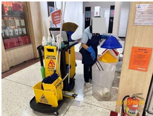
รูปที่ 3-13 พนักงานทำความสะอาดเก็บรวบรวม และขนย้ายขยะ