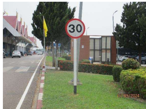
รูปที่ 3-20 ป้ายจำกัดความเร็วยานพาหนะ ที่ใช้ในท่าอากาศยาน