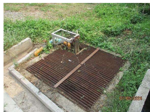
รูปที่ 3-15 รางระบายน้ำรอบอาคารพักขยะ