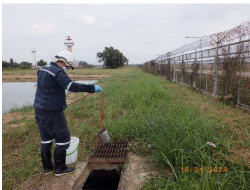
รูปที่ 3-8 การติดตามตรวจสอบคุณภาพน้ำทิ้ง ที่ผ่านระบบบำบัดน้ำเสีย (บริเวณโครงสร้าง คสล. หลังผ่าน Chlorine feed set)