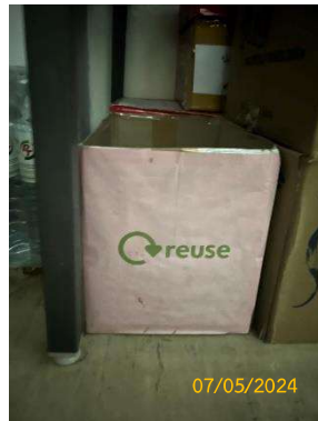
รูปที่ 3-16 การนำกระดาษกลับมาใช้ใหม่