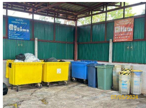
รูปที่ 3-10 ถังขยะแยกประเภทบริเวณอาคารพักขยะ