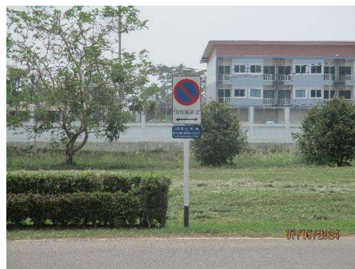
รูปที่ 3-24 ป้ายสัญญาณจราจรภายใน ทขร.