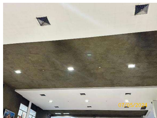
รูปที่ 3-19 บริเวณอาคารผู้โดยสารส่วนที่ติดกับลานจอดอากาศยาน มีการติดตั้งกระจก 2 ชั้น ปูพรม และติดตั้งเพดานยิปซัมบอร์ด เพื่อดูดซับเสียง