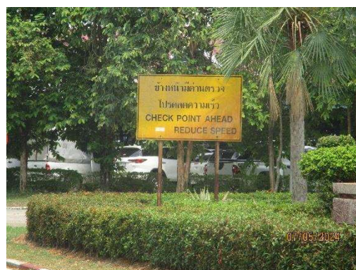
รูปที่ 3-23 ป้ายสัญญาณจราจรบริเวณจุดตัดของถนนและบริเวณประตูเข้า-ออก ทขร.