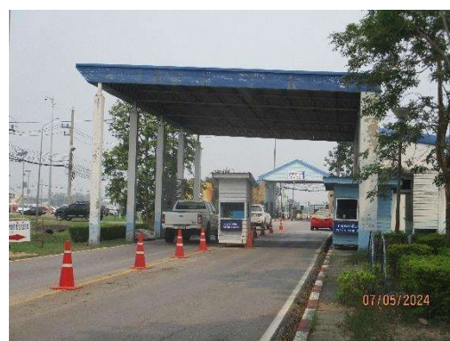
รูปที่ 3-21 เจ้าหน้าที่รักษาความปลอดภัยภายใน ทชร.