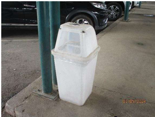
รูปที่ 3-11 ถังขยะบริเวณลานจอดรถยนต์