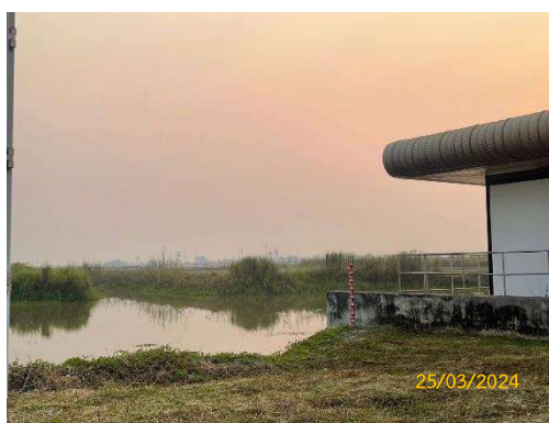
รูปที่ 3-3 สภาพโดยรอบบ่อบำบัดน้ำทิ้ง