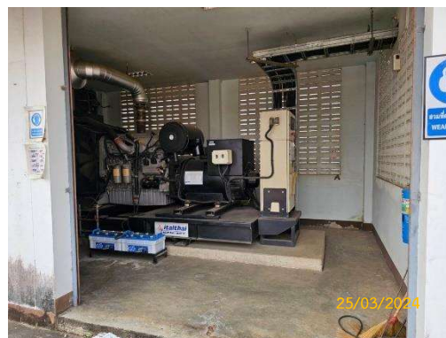
รูปที่ 3-2 เครื่องสำรองไฟฟ้าสำหรับอาคารผู้โดยสาร และระบบบำบัดน้ำเสีย