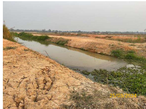
รางระบายน้ำในเขต Landside